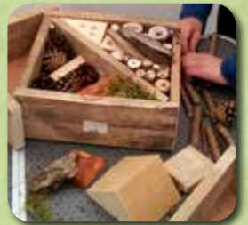
Gîte en construction

Tarif : 8 € (participation à l'achat du matériel)