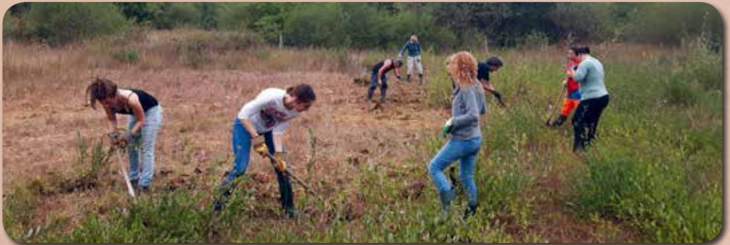
Entretien d'un site par des bénévoles

Prévoir le pique-nique en cas de journée complète.