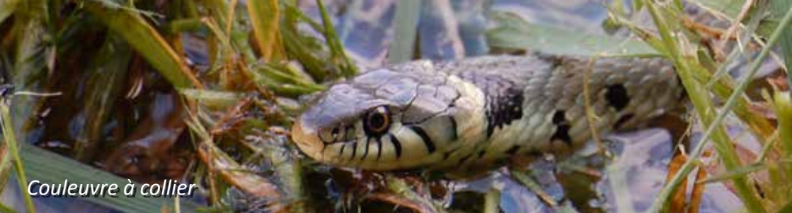
Couleuvre à collier