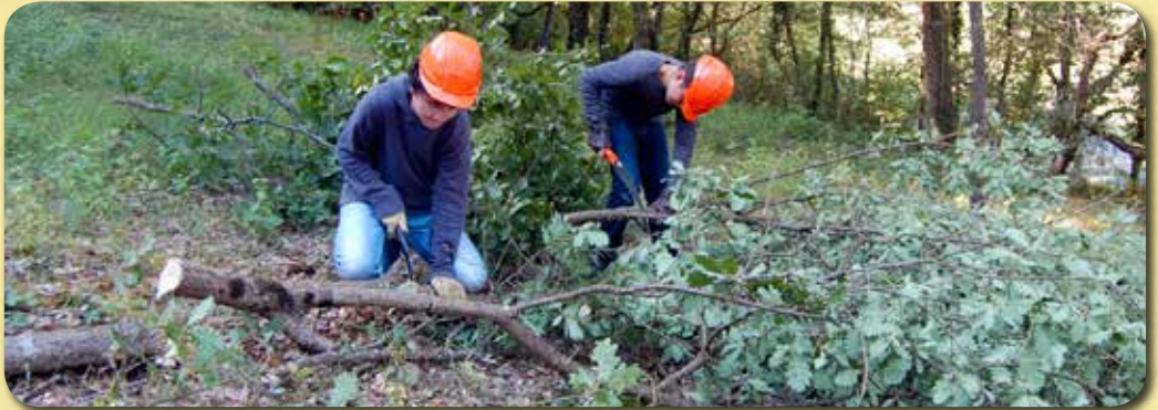
Activités de chantier et déplacements à vélo

Tarif : 120 € pour les 10 jours (hébergement et repas compris).