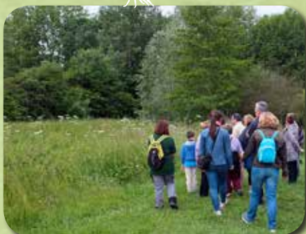
Sortie sur l'ENS du Coteau de Coillard