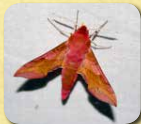
Le petit Sphinx de la vigne