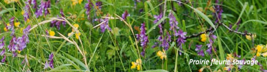
Prairie fleurie sauvage