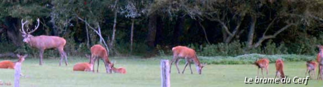
Le brame du Cerf