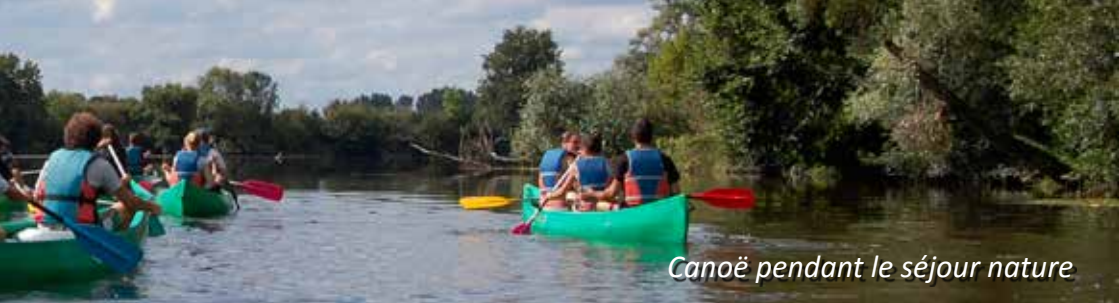
Canoë pendant le séjour nature